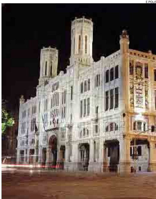
► Tensione ieri sera davanti al municipio