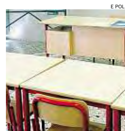
► La scuola si ribella

anni saranno persi in Italia 112 mila posti di lavoro nelle scuole». Una protesta "itinerante" che proseguirà martedì con un presidio davanti all'assessorato regionale della Pubblica Istruzione per poi spostarsi sotto il Consiglio regionale. «La scuola è mortificata, come sempre,