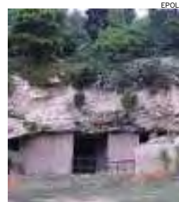
► L'orto dei cappuccini