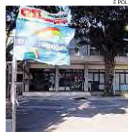
► La sede di Video on line 2

tante della Cisl - e sotto la sede Telecom. Basta con le azioni simboliche e pacifiche: vogliamo risposte certe e subito sia da Telecom sia dalla Regione». L'agitazione tra i dipendenti di Vol 2, tra i quali molte madri e padri di famiglia, cresce assieme alla rabbia. «L'incontro con l'asses-