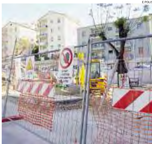
► Il cantiere di piazza Maxia: lavori iniziati a gennaio 2009

«I LAVORI per il completamento di Piazza Maxia procedono a ri-