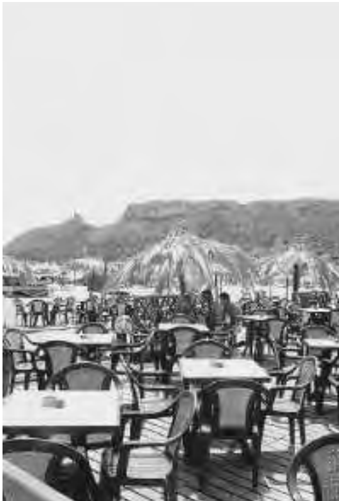
Il caso Poetto-baretti anima il dibattito in Consiglio comunale

Agli uffici, poi, il compito di precisare gli aspetti tecnici del Pul.