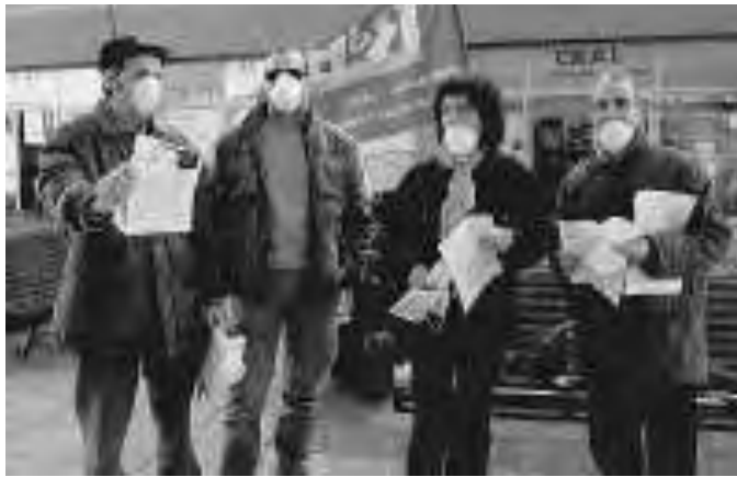
La protesta del sindacato Rdb contro Brunetta

«Questa imposizione — aggiunge ancora il rappresentante delle Rdb — li costringe a recarsi al lavoro nonostante siano colpiti dai primi sintomi influenzali se non vogliono compromettere ancora di più la possibilità di arrivare con lo stipendio alla fine del mese. Anche per questo motivo continueremo a contrastare gli assurdi provvedimenti del ministro Brunetta con ogni mezzo disponibile». (p.s.)