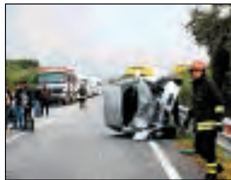
Anche ieri un incidente sulla Sassari-Olbia

Lunedì giornata di mobilitazione I consigli comunali in sit-in a Enas per la quattro corsie