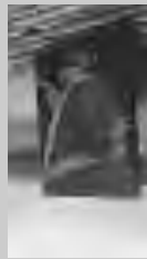
Uno dei dipinti in mostra sino al 9 al Caffè Savoia

CAGLIARI. Pillole di saggezza e di filosofia popolare sono da sempre i proverbi, metafore di vita estrapolate da usi e costumi. Justissima noa feramenta acuta (nuova giustizia strumenti appuntiti) mostra la vecchia diffidenza verso i nuovi codici di giustizia. In su poju sa luna paret un'ateruna (riflessa in una pozzanghera la luna sembra tutt'altra cosa) raccommanda prudenza sui giudizi dati sulle persone. Abba minore non traet mlinu (poca acqua non fa girare il