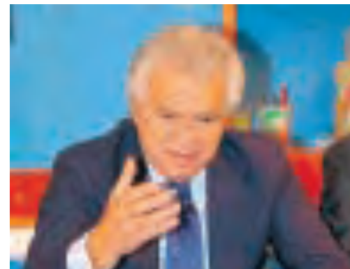
Personaggi A fianco, Denis Verdini. Sotto, Dell'Utri con Berlusconi. A sinistra, il trasporto di una gigantesca pala eolica