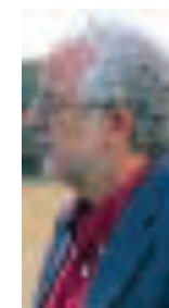
Ignazio Farris. Ex capo dell'Arpas