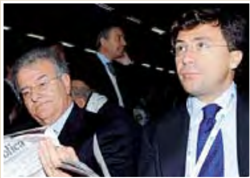
Nella foto grande Silvio Berlusconi; qui sopra Fabrizio Cicchitto e Italo Bocchino; sotto il ministro degli esteri Franco Frattini.

LO SCONTRO. In giornata il Cavaliere aveva preso di mira i finiani. Fuori dalla maggioranza chiunque votasse mozio-